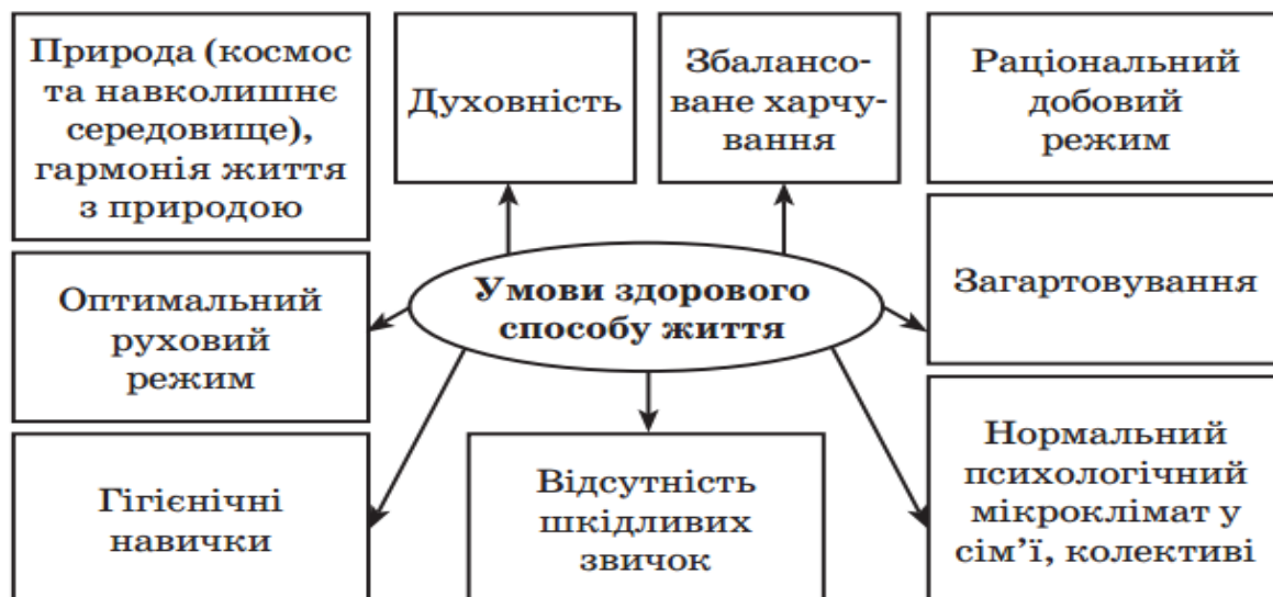
Рисунк 1 – Умови здорового способу життя [1, с.122].

Але необхідно відзначити, що у теперішній час особливого значення набувають наступні тривожні тенденції щодо стану здоров'я молоді [5]: