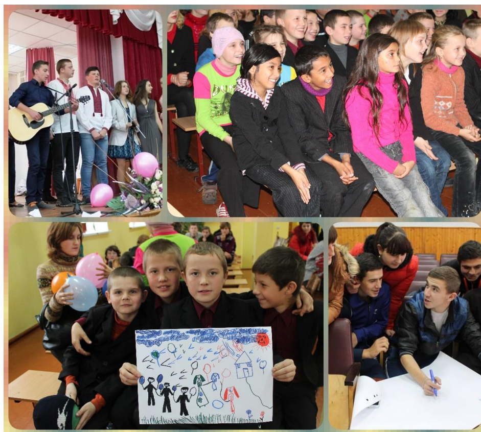
Рис.2 Староприлуцька школа-інтернат. Вистава «Маю право»

Реалізація соціальних проектів - це глобальна платформа для соціалізації студентської молоді. Це є найпростіші форми роботи, але вже такі звичні для нас: культурно-мистецькі програми (традиційні концерти, фестивалі і конкурси), волонтерські програми (участь в благодійних акціях, марафонах), лідерські програми (школи активістів), створення соціальної реклами (плакати, відеоролики), участь в інтерактивних театрах, тощо. Ми завжди прагнемо, щоб формат роботи відповідав викликам часу.