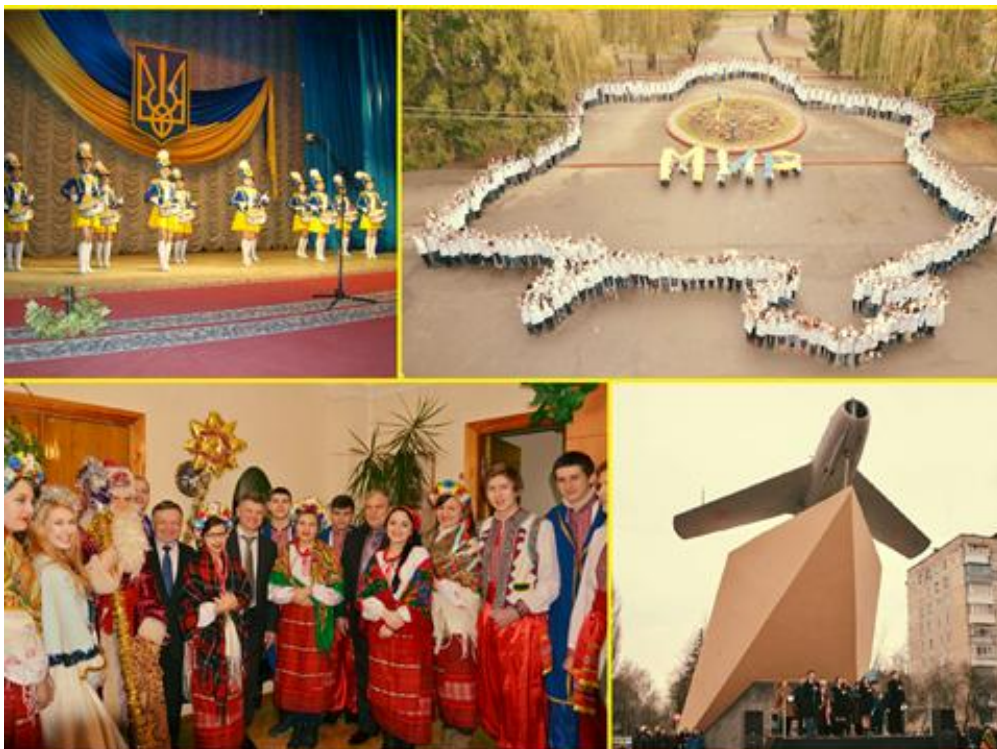
Рис.1 Форми реалізації студентських проектів

Соціальний проект – це сконструйоване соціальне нововведення, метою якого є створення, модернізація чи підтримка в середовищі матеріальної або духовної цінності, яка має просторово-часові та ресурсні обмеження і вплив якої на людей визнається позитивним за своїм соціальним значенням [3. с.95]