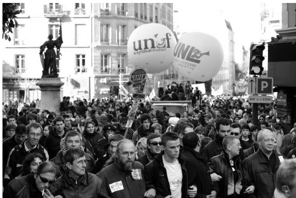
Демонстрація в Парижі 1 травня 2020.

«Як і здоров'я, наші свободи не підлягають обговоренню!»